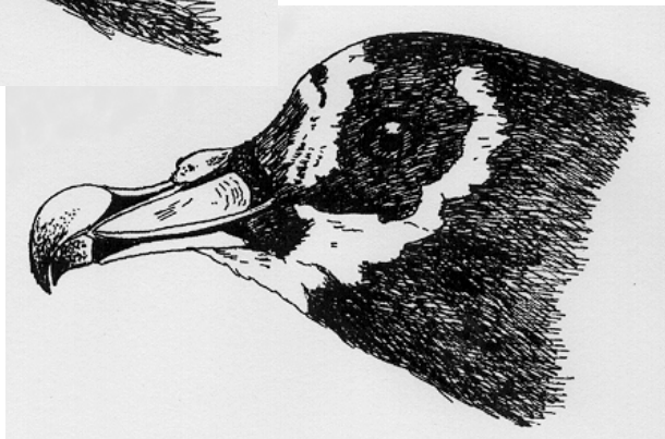
Figura 2. Procellaria conspicillata m Col. Rolf Grantsau Nº 9535 19/5/1995. RS Ct. 450; as. 346; cul. 50; ta. 65 mm